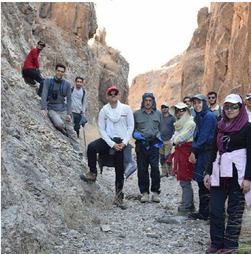
مسیر قله یخاب