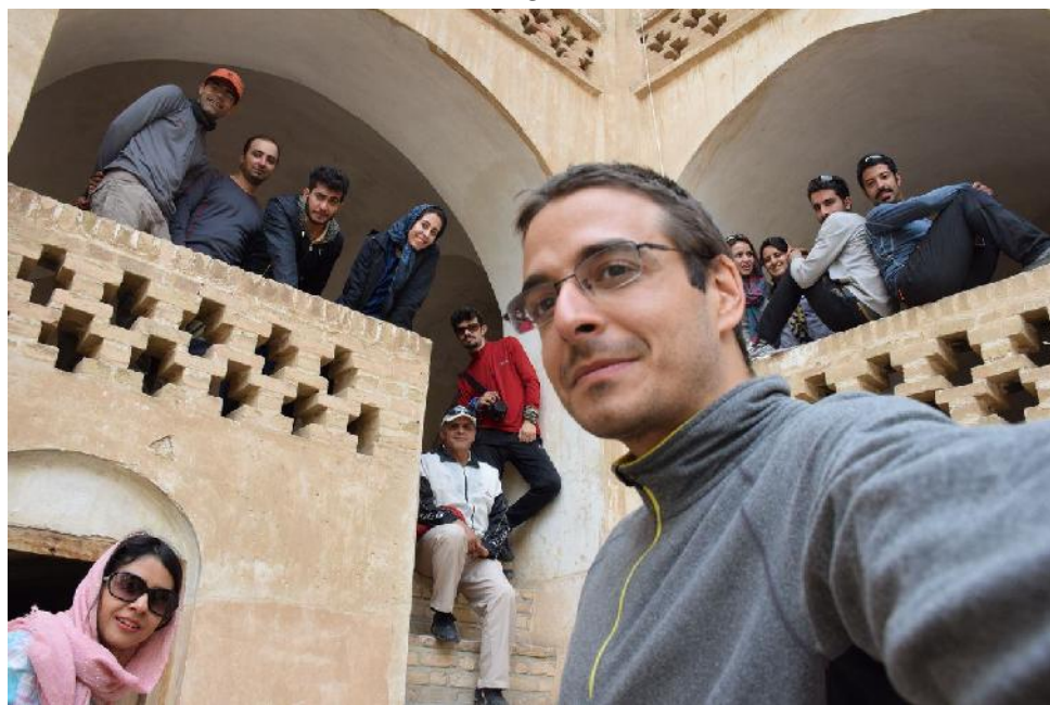
مسجد جامع نطنز