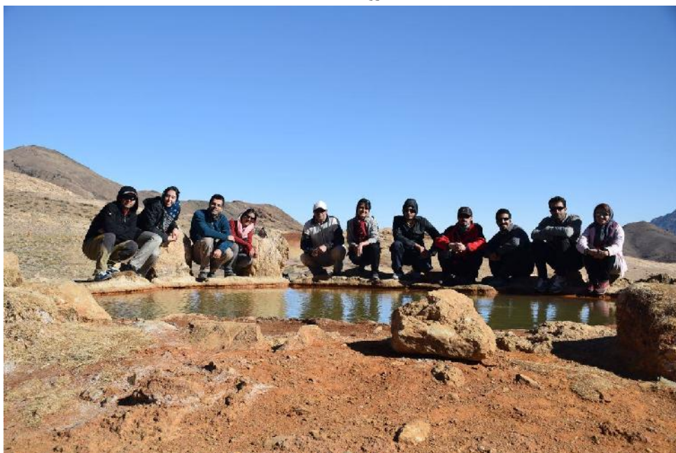
چشمه سرخ فریزهند